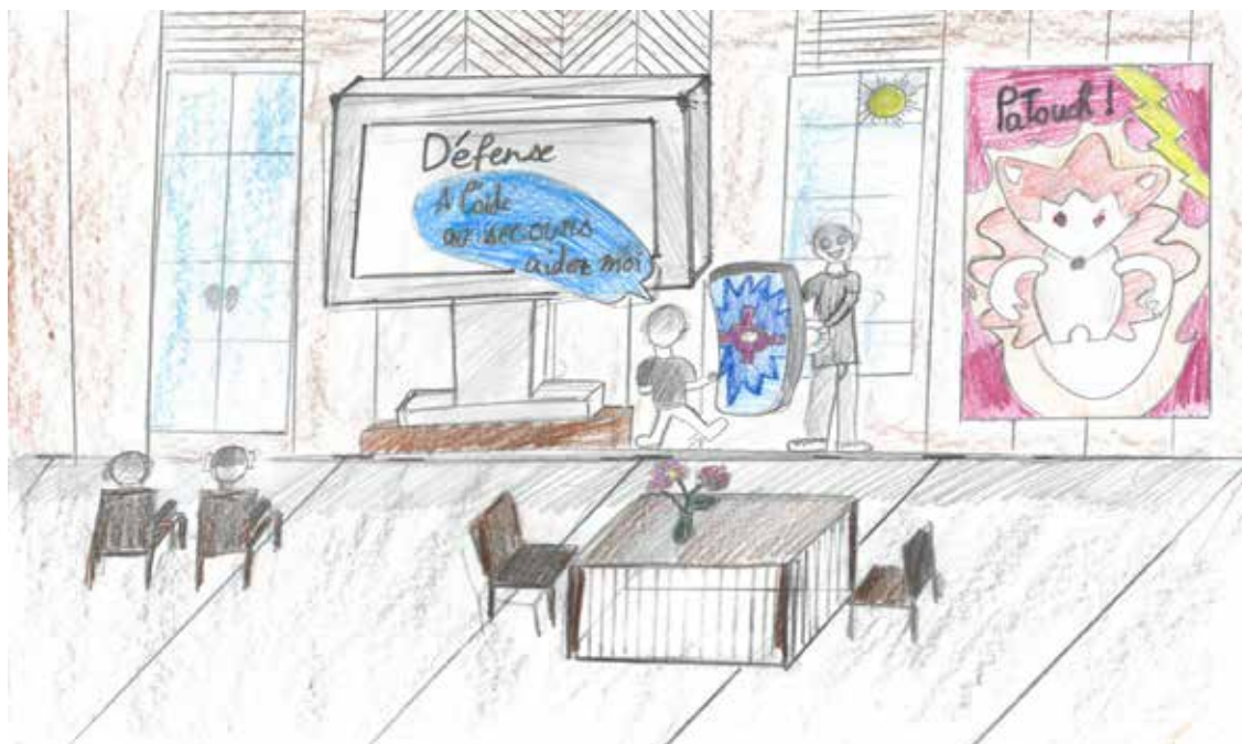
Comment nous avons appris à frapper en cas d'agression – par Ethan Dubey