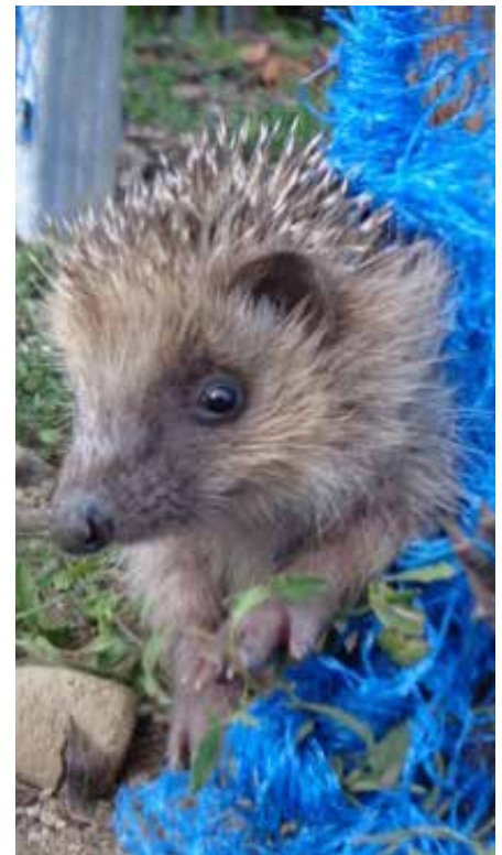
Jeune hérisson pris dans un filet.