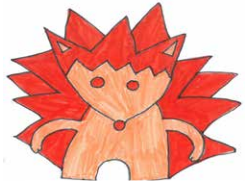
La mascotte Patouch – par Mandy Vernez