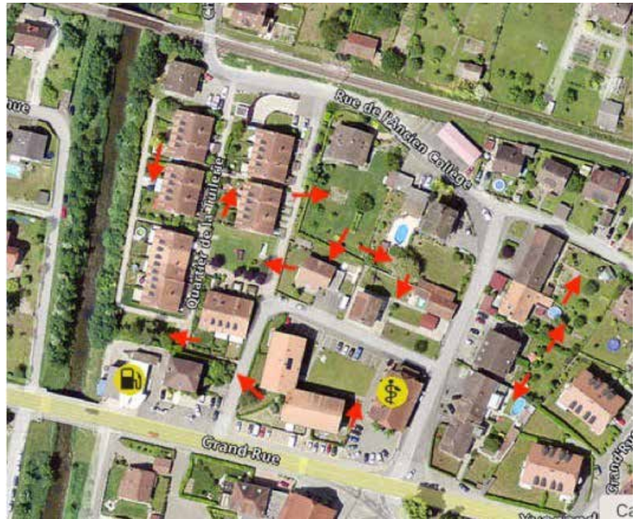
Exemple dans le périmètre du quartier de la Tuilerie-Vieux-collège, malgré une urbanisation importante, des passages peuvent être créés entre les jardins.

Avant de passer la débroussailleuse, vérifiez qu'aucun hérisson n'est caché dans le secteur et si vous utilisez un