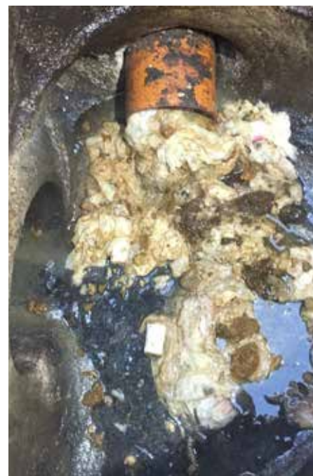
Lingettes, cotons démaquillant, le meilleur moyen pour boucher des canalisations