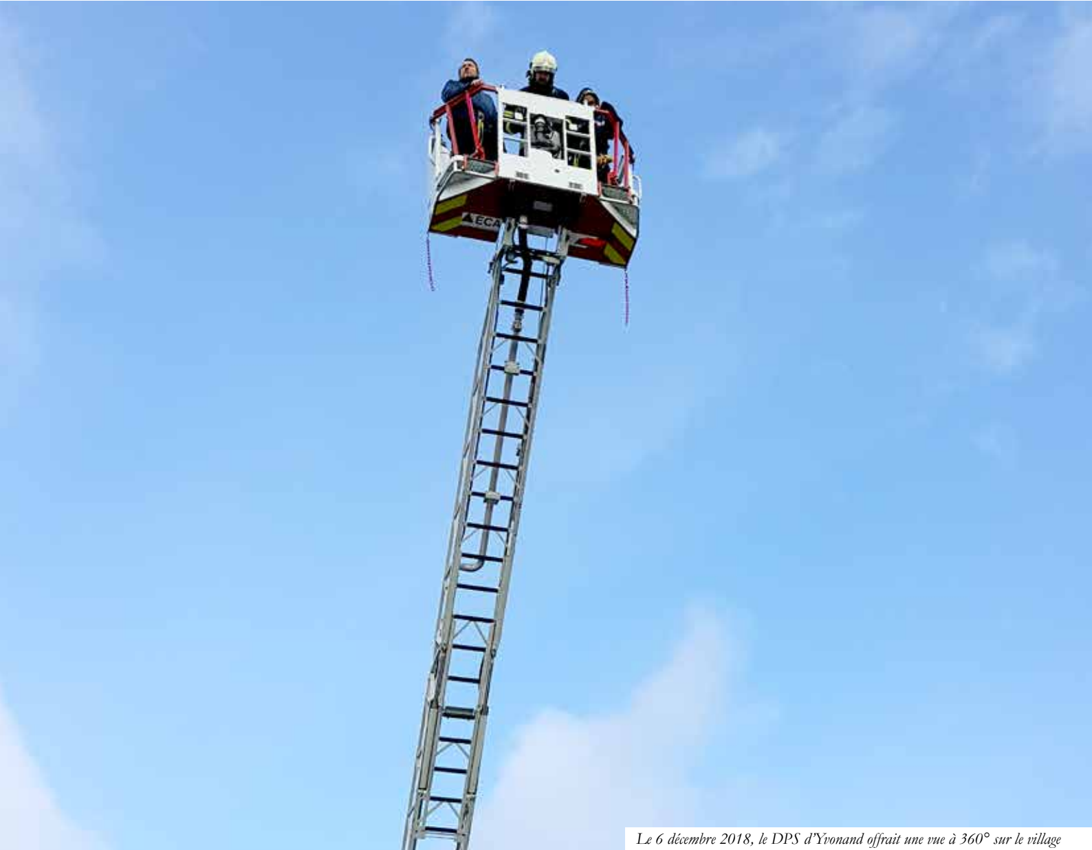
Le 6 décembre 2018, le DPS d'Yvonand offrait une vue à 360° sur le village

BULLETIN D'INFORMATION DE LA COMMUNE D'YVONAND | 26 E ANNÉE | N° 1 FÉVRIER 2019