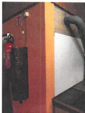
Moteur grill extérieur