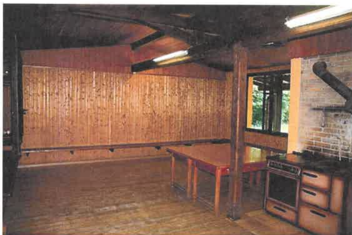
Vue de l'intérieur