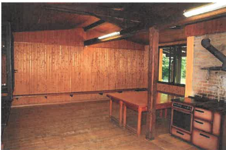
Vue de l'intérieur