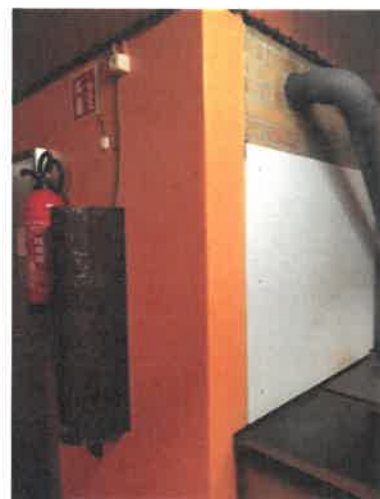
Moteur grill extérieur